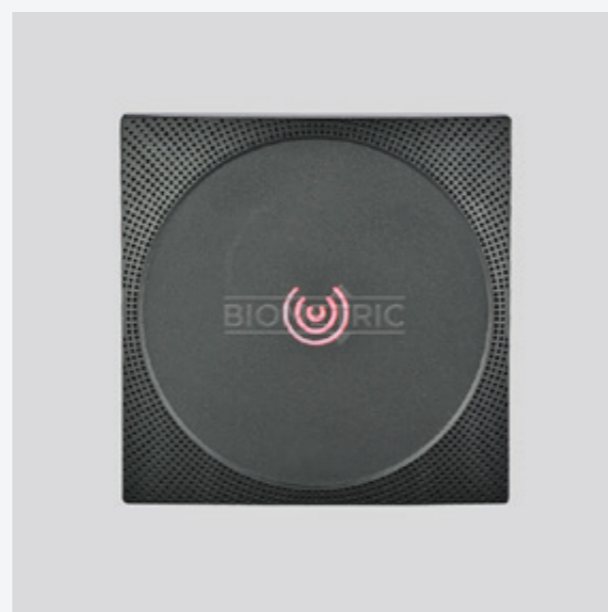
RFID čítačka KR610